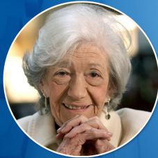
Ana María Matute